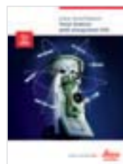
Leica SmartStation Brochure prodotto