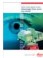
Leica DNA Brochure prodotto