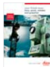
Leica TPS400 Brochure prodotto