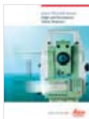
Leica TPS1200 Brochure prodotto