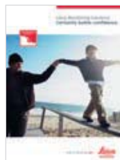
Leica Monitoring Solutions