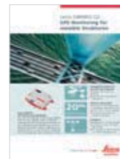
GPS/GNSS Leica GMX902 GG Leica GRX1200 Series Leica GPS1200 Series Leica GMX901