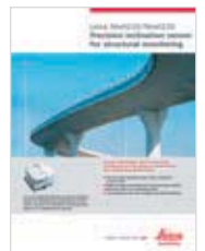
Altro: Leica Nivel210/220 Leica GPR112 Prisma per Monitoraggio